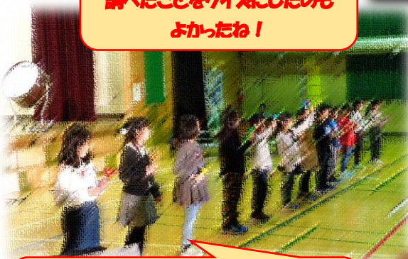
3年生 美しいハンドベルの音色が 体育館に響きわたりました。