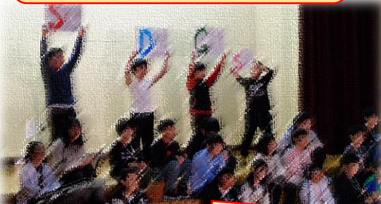
5年生 学習の足跡が見える発表！ 一人一人が本気で取り組む姿に感動！