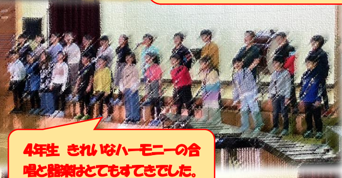
4年生 きれいなハーモニーの合 唱と器楽はとてもすてきでした。