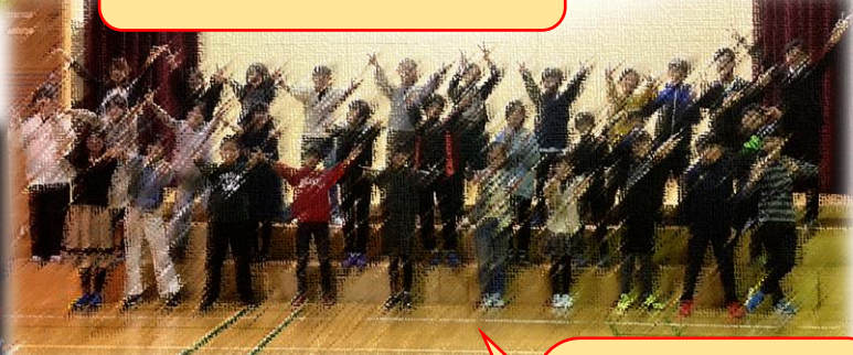
6年生 最後の学習 発表会、達成感や満足 感を感じられる花丸の 発表でした。