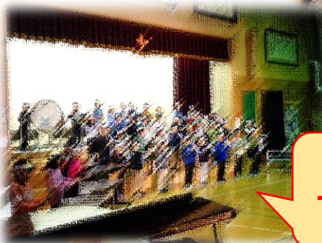
2年生 上手に演奏できるようになりました。 入退場もばっちり！