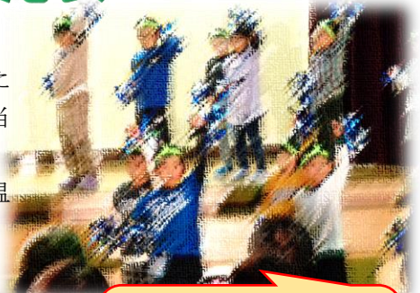
1年生 のいのいのダンス かわいかったです。

以前にもお伝えしております通り、大変限られた練習時間ではありましたが、子どもたちは最高の発表にするため一生懸命練習していました。発表会当日は、そんな練習の成果が随所に見られた感動のステージだったと思います。保護者の皆様におかれましては、お忙しい中、来校いただき、子どもたちに温かな拍手を送っていただいたことに心より感謝申し上げます。